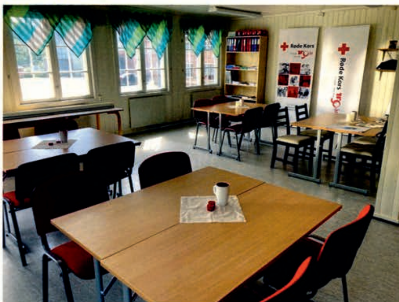
Lokalene på Brenneriet fra august 2020

Fra juni 2016 til mars 2019 leide Løten Røde Kors lokaler på Bøndernes hus til kontor/møterom og et lagerrom for oppbevaring av hjelpekorpsets eiendeler. Fra mars 2019 holder hele LRK til på "Kilde". Høsten 2020 tegnet vi avtale med Løten Brænderi for å leie lokaler. Fine lokaler med plass til Hjelpekorpsets sitt beredskapsutstyr og kjøretøyer.