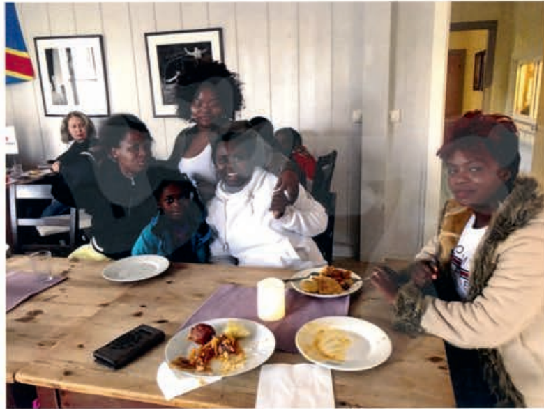
Kongolesisk matdag på kafeen vinter 2019

I 2018 og 2019 har LRK Omsorg også vært med på ordningen med "Ønsketreet på var sammen med Hamar, Vang og Stange Røde kors.