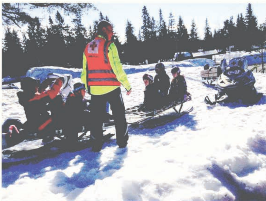
Hjelpekorpsset har aktiviteter på Vintercamp for barn.