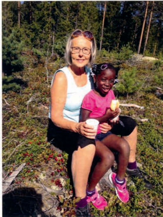
Sommer Camp for barn

I 2015 ble Løten Røde Kors vintercamp for barn arrangert for første gang. Formålet er integrering og sosiale ferdigheter. Det er en overnattingstur på vakthytta på Budor, med vinteraktiviteter og førstehjelp. Likeledes ble det arrangert sommercamp ved Mosjøbergkoaia med sommeraktiviteter og padling på Mosjøen. Campene ble populære, og de er gjentatt i 2016 - 2019.