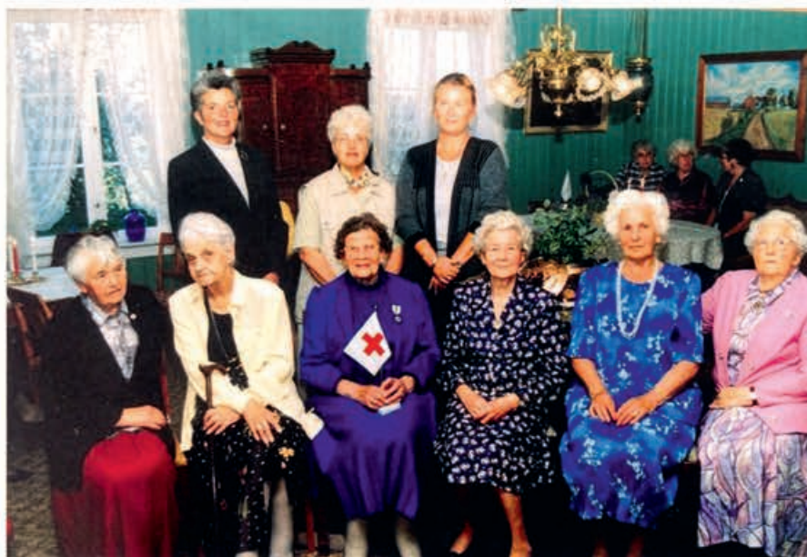
Røde Kors besøkstjeneste 40 år.