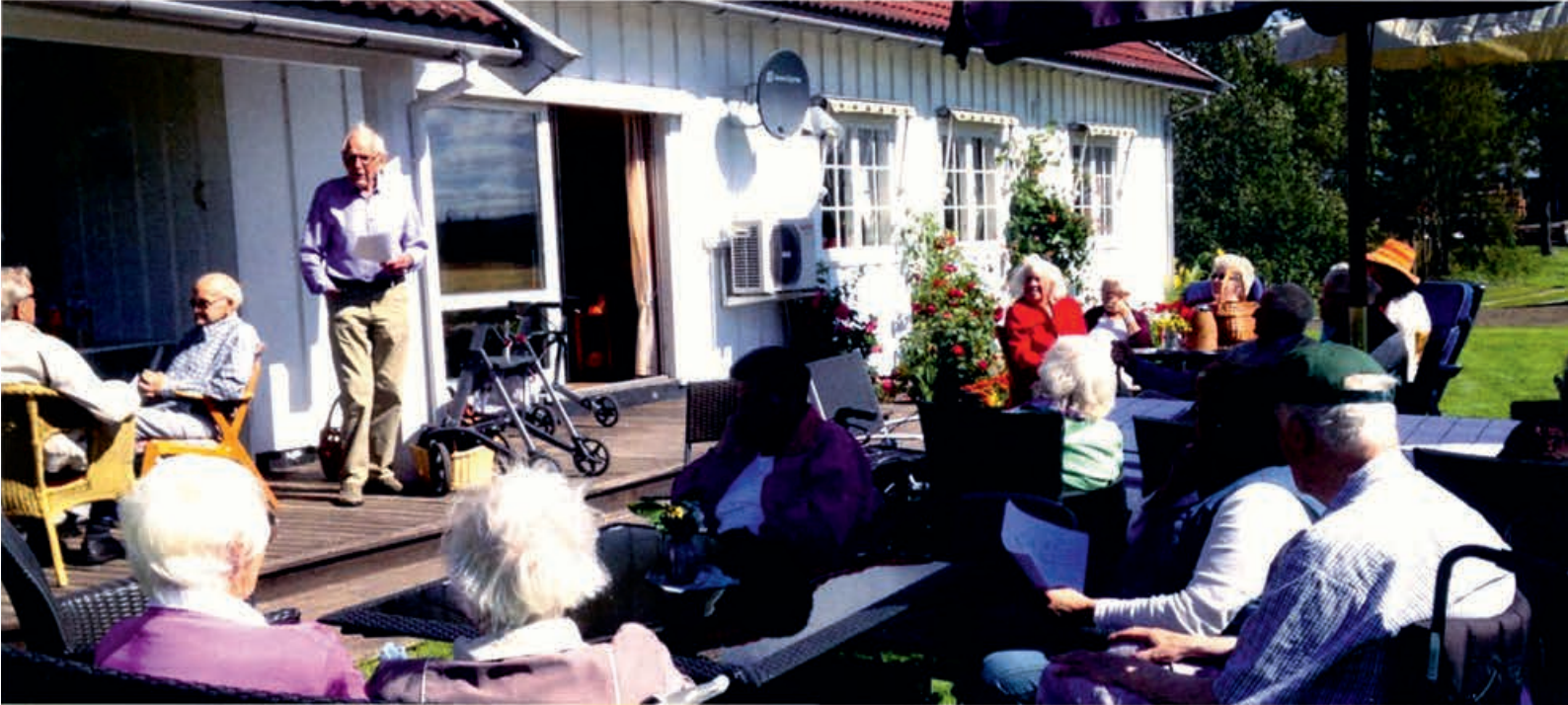
Glade pensjonister på Valdres-tur